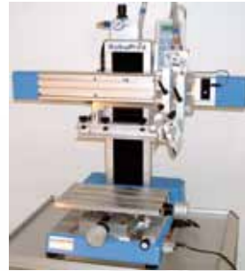
Table de réglage KO 03 Permet le montage des outils de posage d'objets. Réglages micrométriques en X et Y.

De nombreux accessoires sont disponibles pour la SD 05.