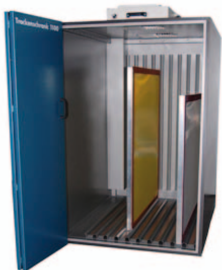
Armoire de séchage 1100-V

L'armoire de séchage 1100-V est équipée de 10 glissières de séchage verticales. Une double porte battante avec poignée à verrouillage magnétique permet un accès aisé. Les rails sont faits en acier inoxydable et chacun est équipé d'un pad de Teflon pour faciliter le chargement. Les glissières sont de conception robuste pour assurer un stockage sûr pour différents types de formats d'écrans. L'armoire de séchage 1100-V possède un système de soufflerie à air chaud puissant, qui aspire l'air ambiant par un pré-filtre fin. L'air ambiant ou de l'air chaud jusqu'à 40° c peut être utilisé pour le séchage. Un design de flux d'air aérodynamique unique distribue l'air filtré verticalement, permettant à l'air d'absorber l'humidité dans l'étuve. Le tuyau d'échappement de diam. 100 installé sur le dessus évacue l'air humide de l'unité. Une vanne de régulation permet un ajustement précis de la puissance d'air.